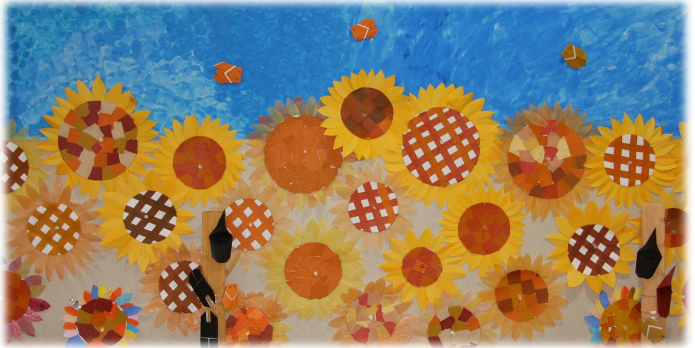
デイサービスの作品 『ひまわり』