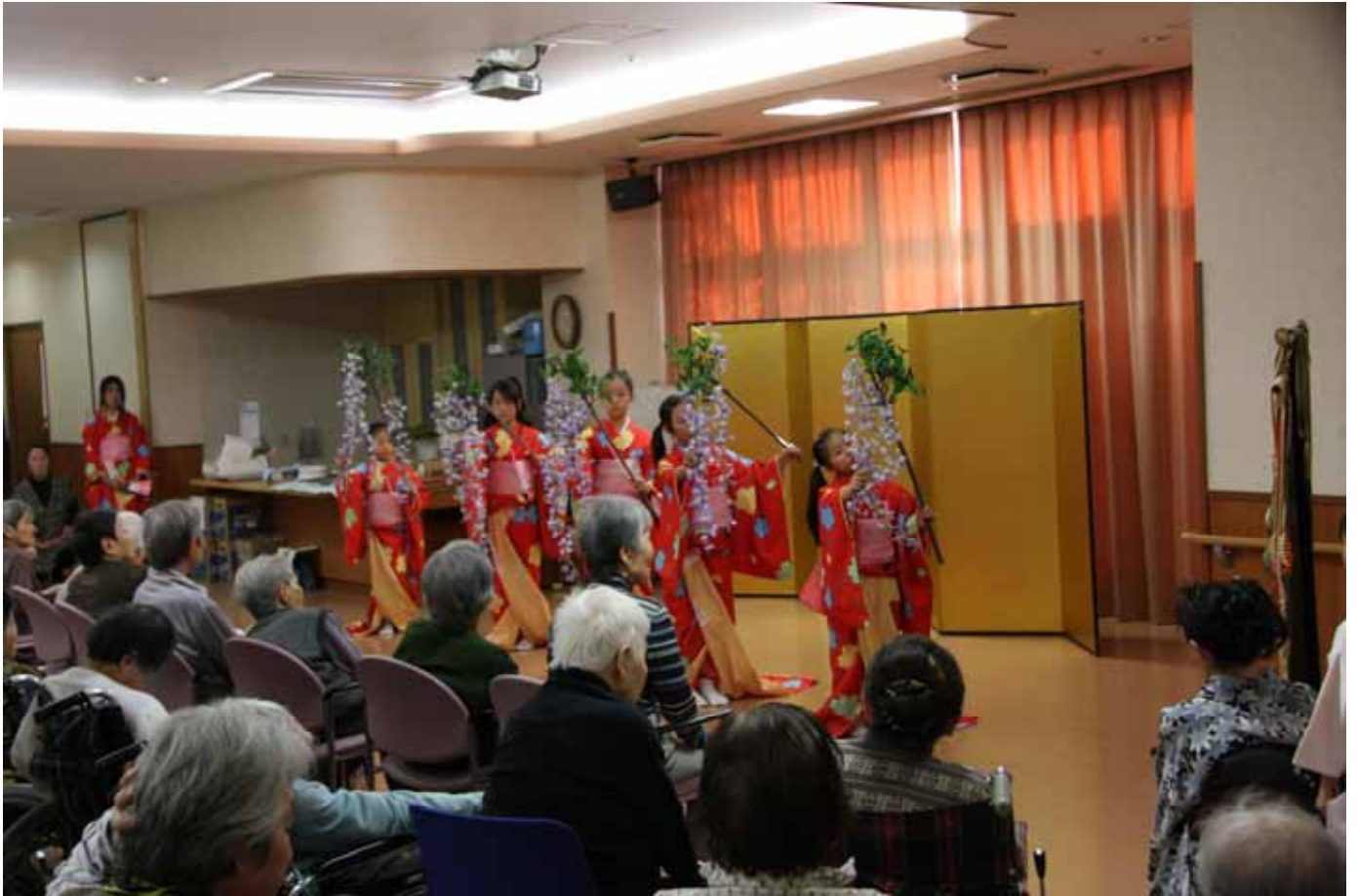
日本舞踊 美月流の皆様が踊りを披露しに来られました。

Vol. 64 11月は外出企画や日舞、歌の発表会などイベントが盛りだくさんでした。