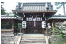
膳所城より移築された犬走り門

また、社殿は延喜17年(917)雷火で全焼、その後寿永3年(1184)源頼朝と木曾義仲の粟津の合戦でまたも全焼し、勝った頼朝が社殿などを再建したが、応仁の乱(1467)の兵火で三度焼失しています。その後も立派に復興され、膳所城築城後の歴代城主・本多公が寄進で鋭意整備・修繕されており、境内には、皇太神宮をはじめ数多の摂社・末社が奉祀されています。