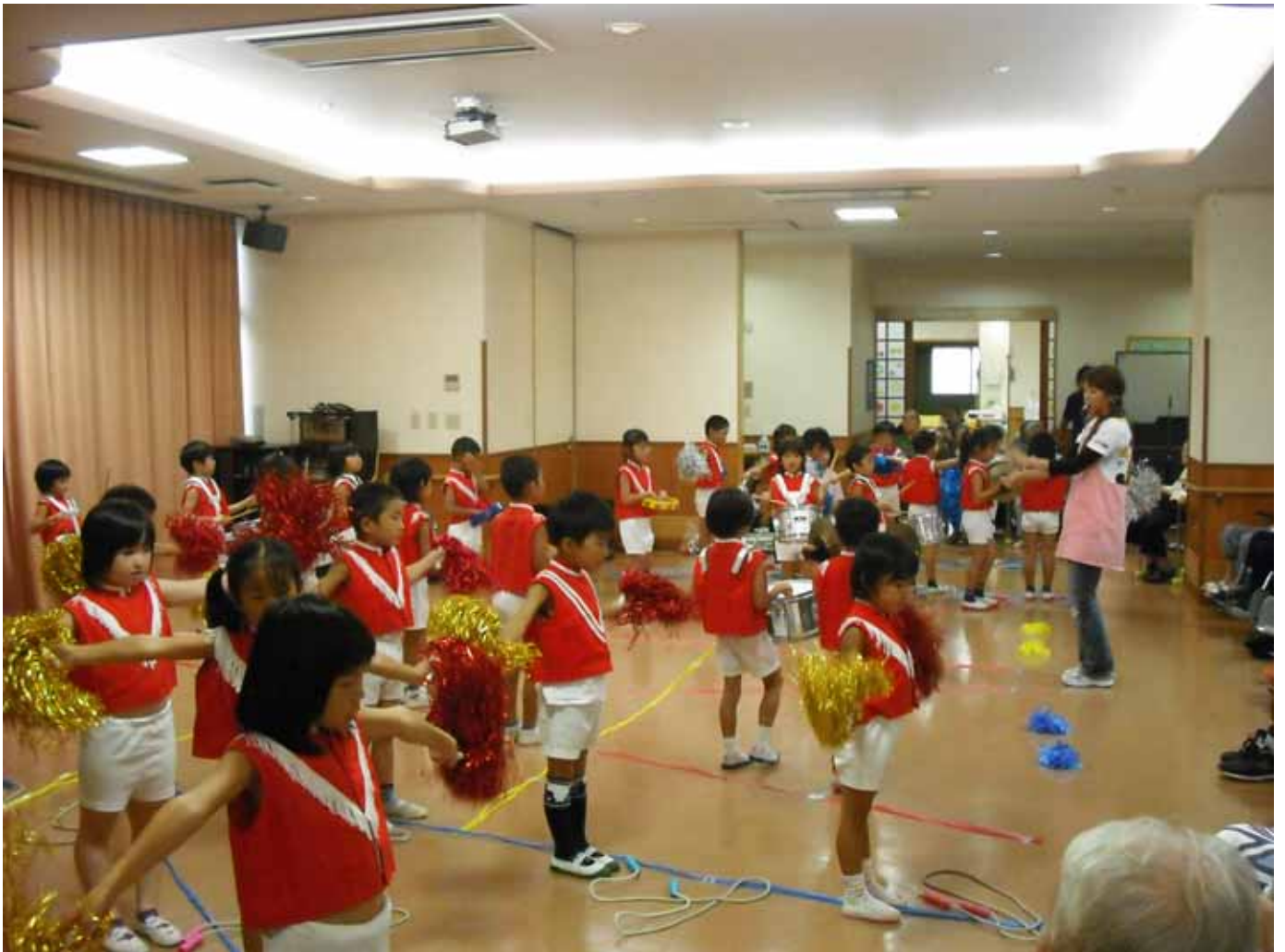
田上保育園の皆さんがマーチングバンドを披露しに来られました。

Vol. 63 10月はイベントが盛りだくさんでした。11月も外出の計画があります。