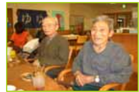
たこ焼き機を使ってのカステラ作り