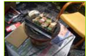
焼き鳥をしました。もちろん炭火焼！！

皆でサンドイッチを作りました。本当は外の公園で食べようと思っていたのですが・・・あいにくの天気でこの日は室内で。