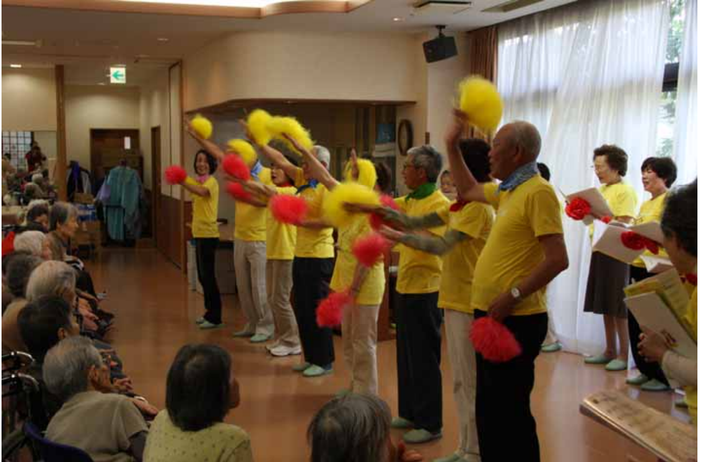
サウスウインドの皆様が歌のプレゼントにこられました。

Vol. 58 5月は地域交流スペースでのコンサートのイベントが多くありました。