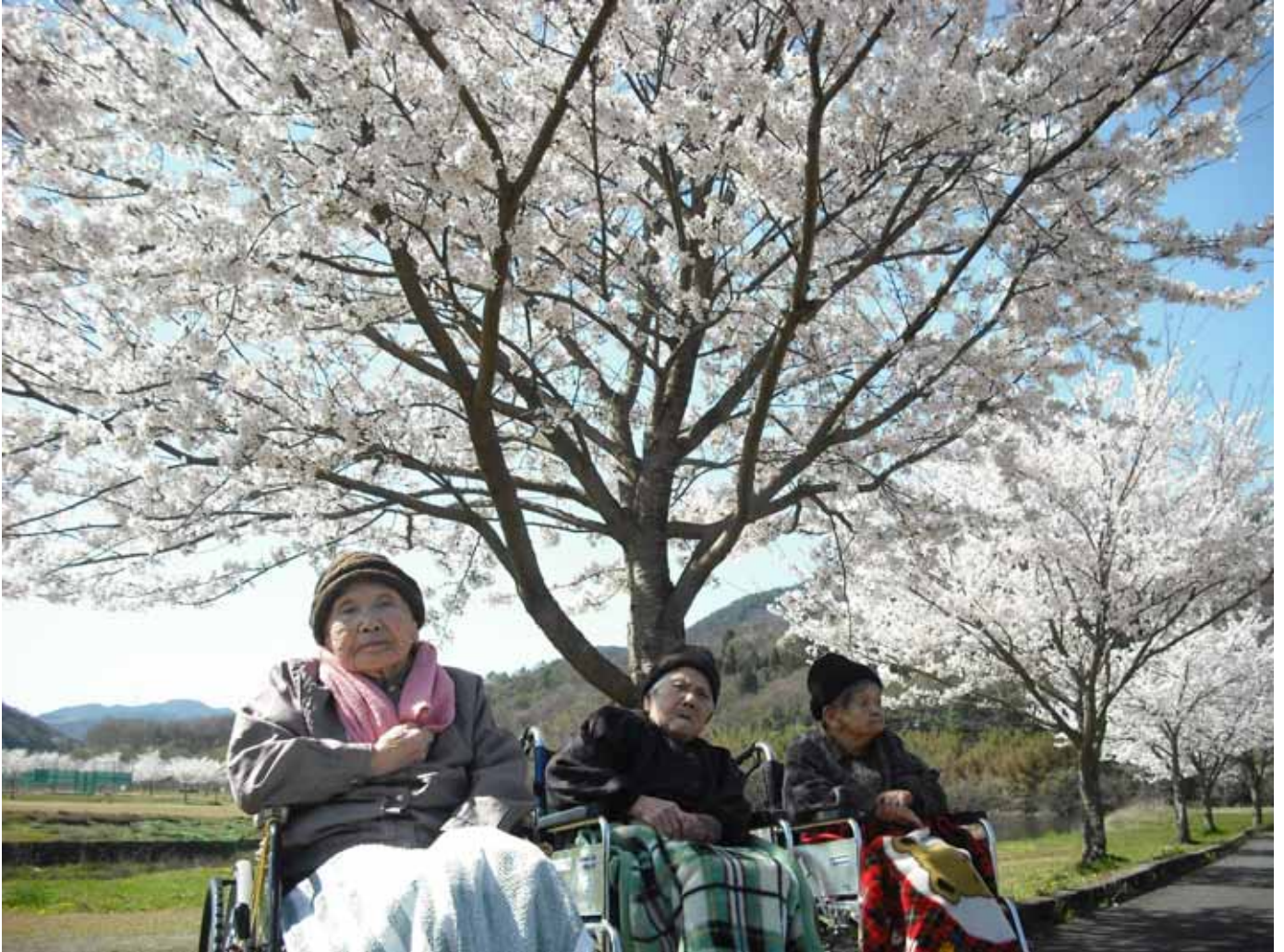
「大石緑地スポーツ村」へお花見に出かけました。

Vol. 57 4月は寒暖の差が激しかったですが、皆様、体調は崩しておられませんか？