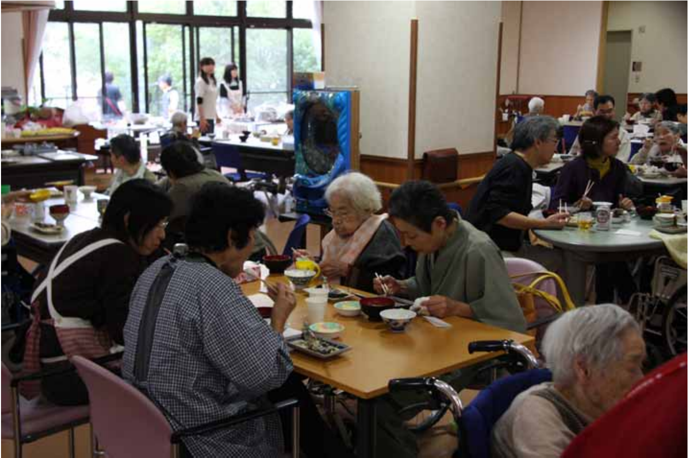
毎年恒例の『秋の食事会』今年は昼に開催です。

Vol. 51 周りの木々も色づいてきましたね。11月は紅葉の外出企画がいっぱいです。