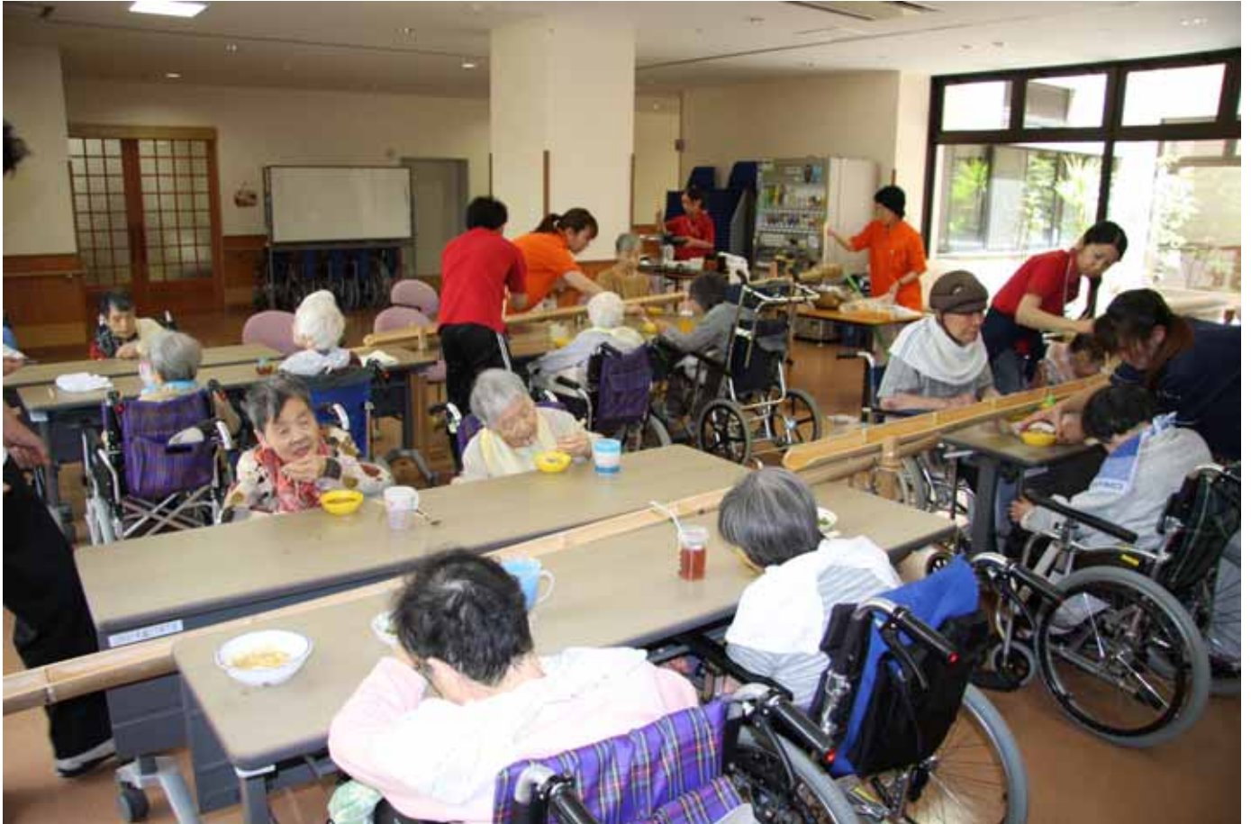
夏の風物詩、流しそうめんを行いました。

Vol. 48 7月は梅雨が明けませんでしたが、イベントが盛りだくさんの月でした。