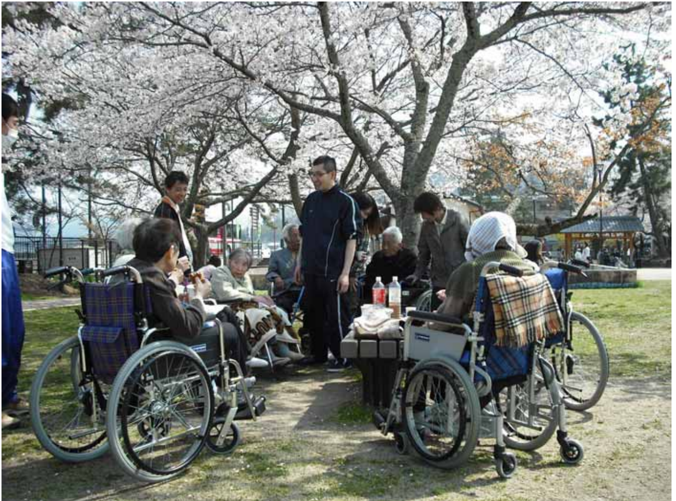
南郷公園にてTea Time。満開の桜の下でのおやつは格別です。