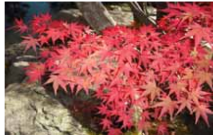
文化ゾーンの紅葉も見ごろでした。