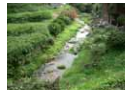
天神社下を流れる奥山田川。