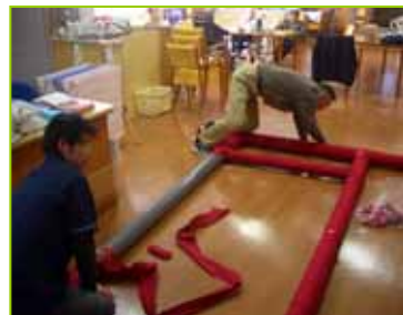
デイサービスにて作成中。利用者様に布巻きを手伝っていただきました。

入居者様は元旦から地域交流スペースに降りてこられ、大石神社へお参りし、おみくじを引いたり、お神酒(梅酒)やミカンなどを食べておられました。皆様、今年はどうな一年になるのでしょうか??