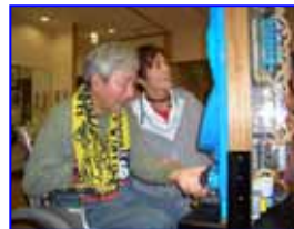
パチンコ台は「海物語」

今回施設にて入居者様に楽しんでいただこうとパチンコ台を購入しました。昔のパチンコ台とは違うので戸惑っておられましたが楽しんでいただければ・・・と思っています。