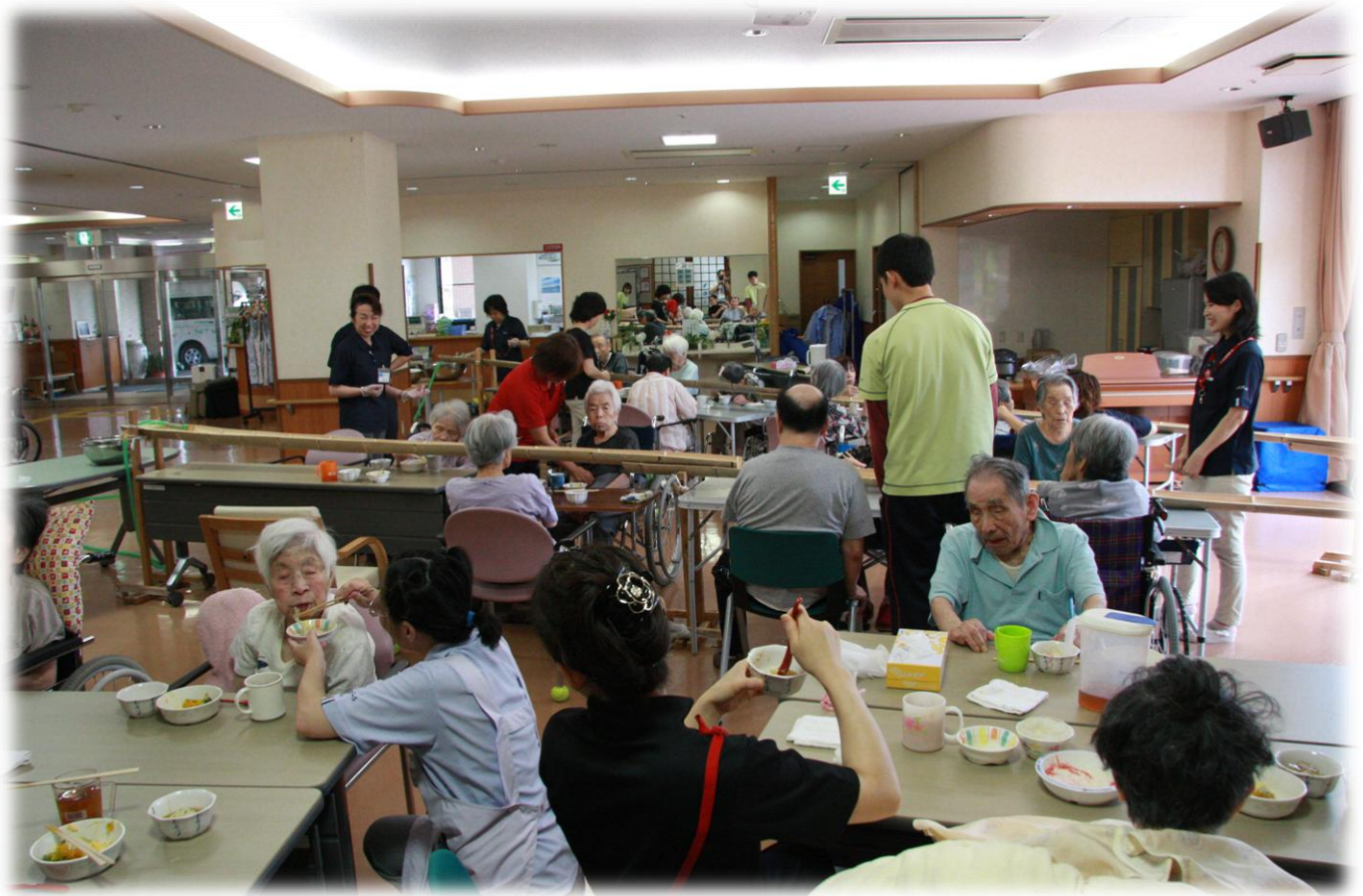
リバプールの夏の風物詩、流しそうめん！

2014・8月号 Vol. 108 夏本番！最近は残暑も厳しく、夏が長く感じます。