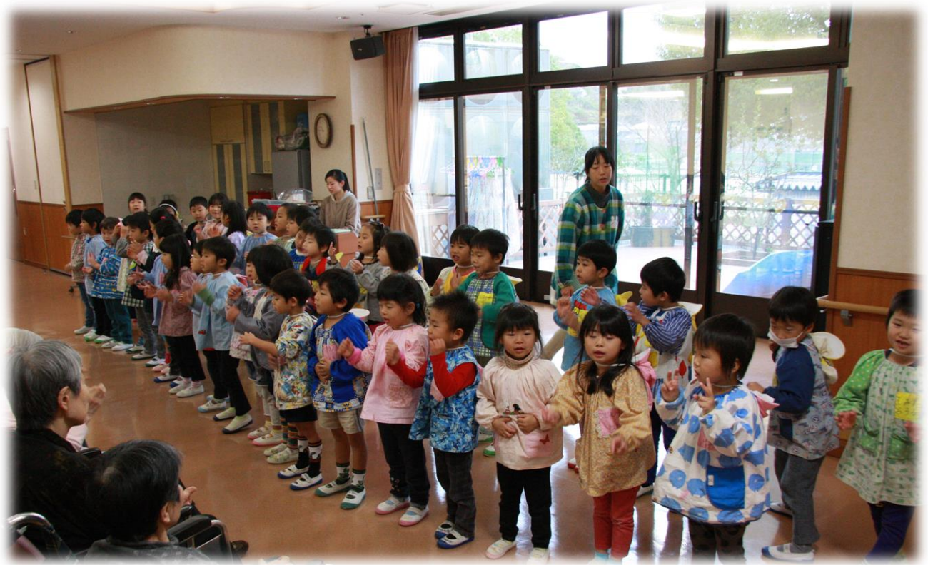
お隣の大石幼稚園の園児さんによる歌の会。