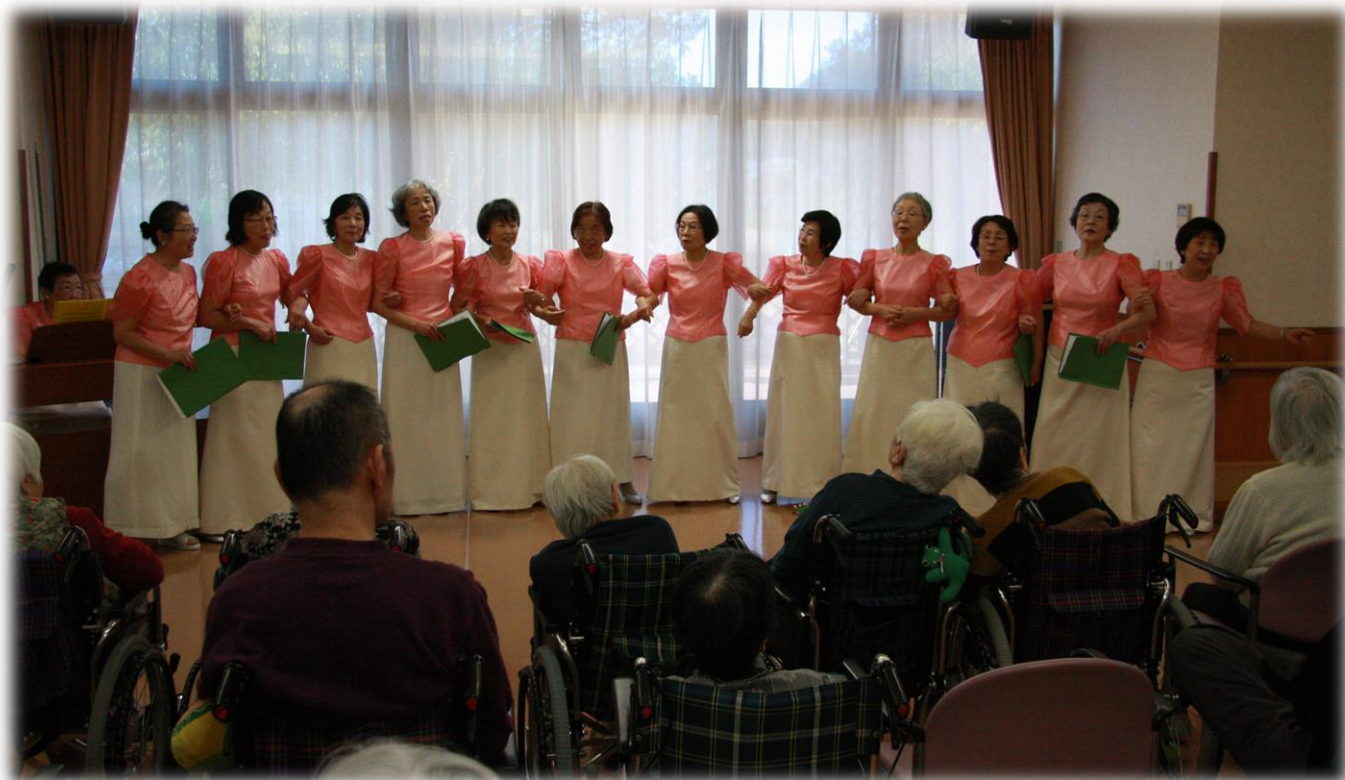
大津市国際親善協会合唱団の皆様による演奏会

2016・1月号 Vol. 125 明けましておめでとうございます。大石も暖かなお正月を迎えました。