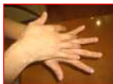
手の甲を伸ばすようにこする