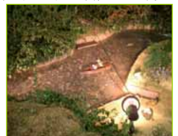
先日の大石地区文化祭にて出展してありました模型です。

昭和39年(1964)、天ヶ瀬(あまがせ)ダムの完成で曾東の渡し場は水没しますが同年アーチ式の曾東大橋が架設されて、交通路は回復しました。(参考：大津市史)