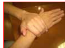
手首も忘れず洗う