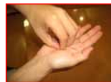
指先・爪の間を念入りに洗う