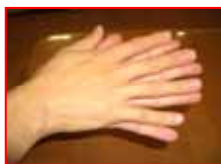
手のひらをよくこする