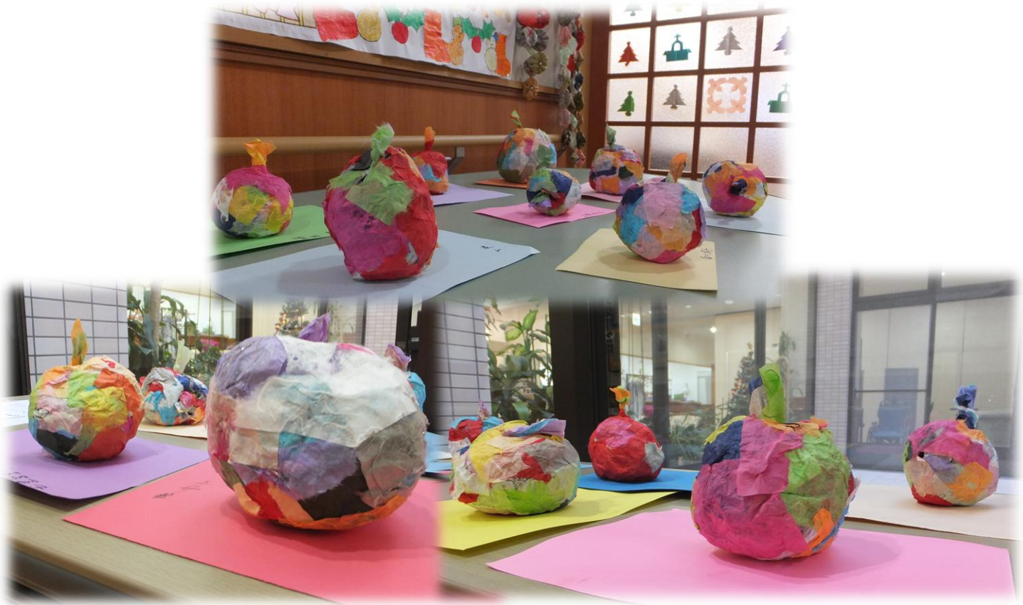
11/21 臨床美術 色とりどりのリンゴたち！

2014・12月号 Vol. 112 今年もあと残りわずか、リバプールにもサンタがやってきます！