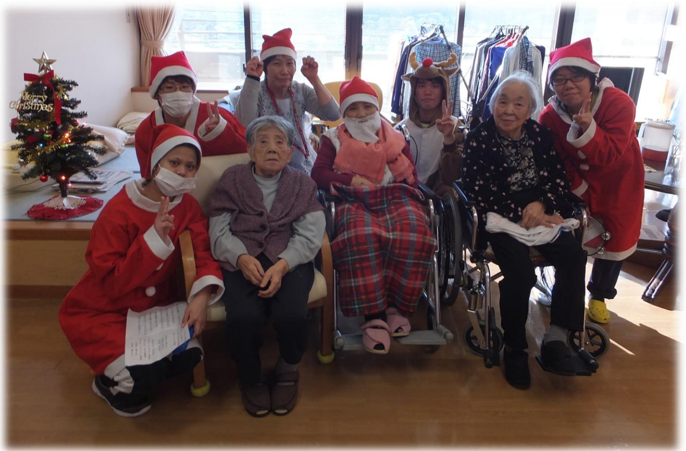
12/19 クリスマス会、サンタと記念撮影！

2015・1月号 Vol. 113 明けましておめでとうございます。今年も皆様の笑顔をお届けします！