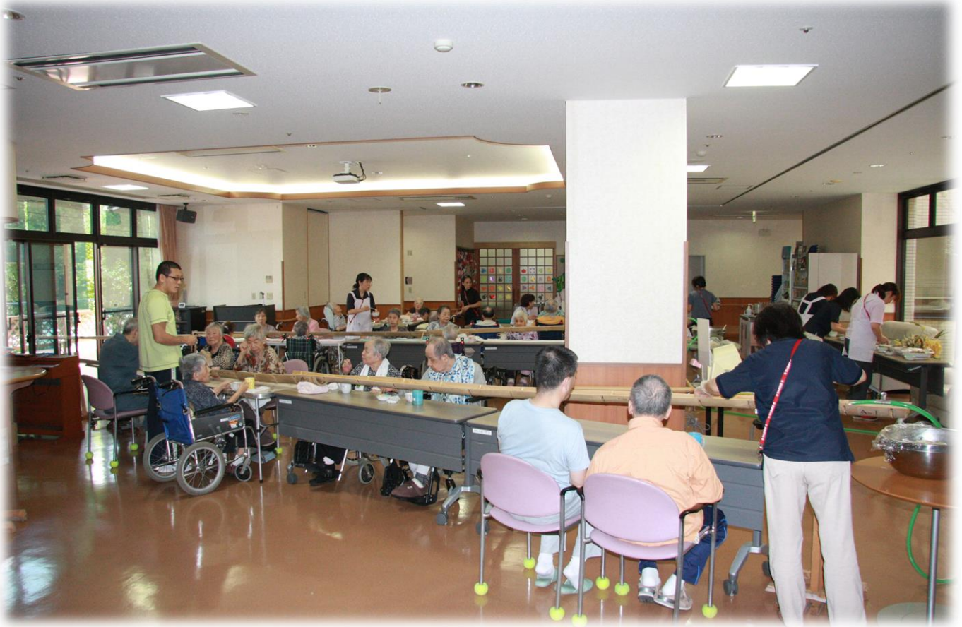
リバプール夏の風物詩 流しそうめん！

2015・9月号 Vol. 121 夏の暑さはどこえやら、朝晩は肌寒い今日この頃。