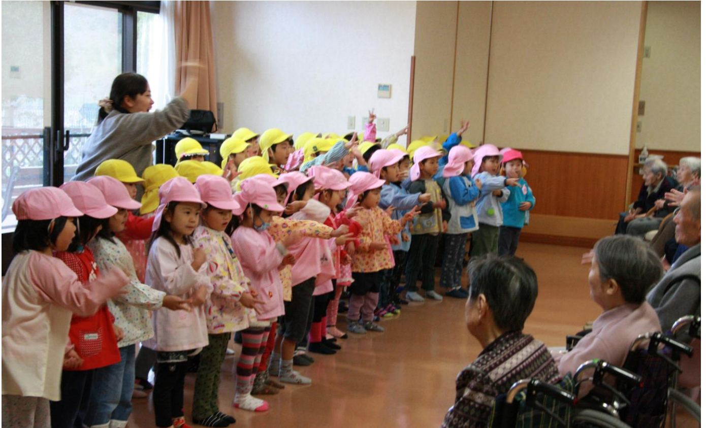
11/27 大石幼稚園園児さんによる歌の発表会。じゃんけんポン！！

2012・12月号 Vol. 88 今年もあと僅か！リバプールにもサンタがやってきます。