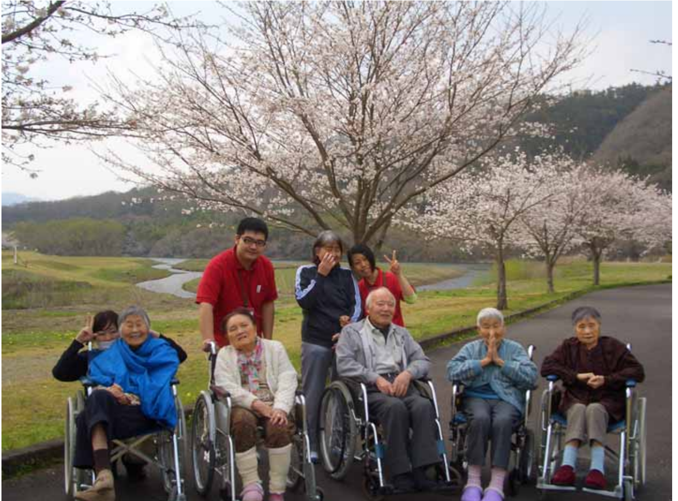
大石緑地スポーツ村まで散歩と花見に行きました。