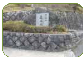
真言宗遍照院 3月末に訪れたので紅梅が見頃でした。