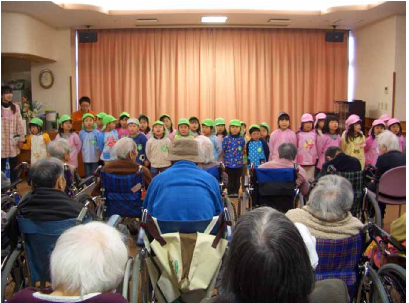
大石幼稚園の年少組さんが歌のプレゼントにきてくれました。

この度、東日本大震災により被災されました方々に心よりお見舞い申し上げます。 被災地の復興と、被災された皆様に生活の安寧と笑顔の戻る時が一日も早く訪れることを、 心よりお祈り申し上げます。