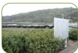
山口城跡 現在は茶畑が広がっています。

家康が立ち寄った真言宗遍照院は元亀元年(1570年)の建立であり、境内には紅梅の古木があり、花の咲くころには訪れる人も多いとされています。