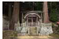
琴平神社とご神木