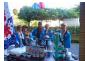
ボランティアに参加いただいた皆様

また、ボランティアで来てくださったたくさんの方々も本当に有難うございました。心よりお礼申し上げます。